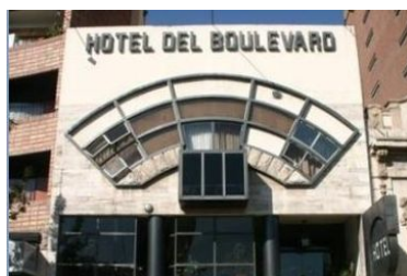
HOTEL DEL BOULEVARD Boulevard Illia 184 (351) 4264115