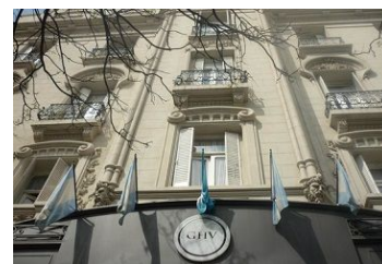
GRAN HOTEL VICTORIA Peatonal 25 de Mayo 240 www.granhotelvictoria.com.ar Tel: + 54 (351) 429 0898 – Mov.+ 54 (351) 7516274 consultas@granhotelvictoria.com.ar