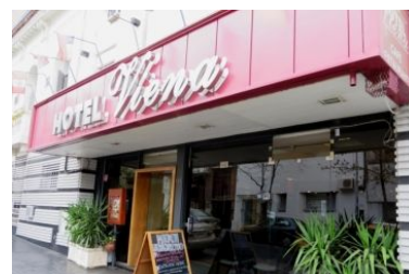
HOTEL VIENA Laprida 235 www.hotelviena.com.ar