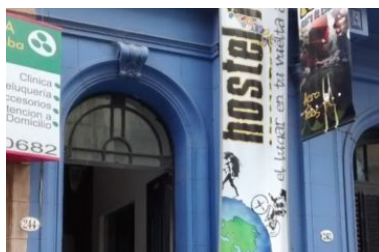
RUPESTRE HOSTEL Obispo oro 242 www.rupestre.insta-hostel.com