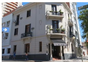
GRAN REX HOTEL Vélez Sarsfield 601 www.hotelrex.com.ar