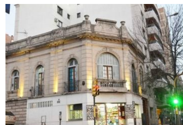
RIVERA HOSTEL CÓRDOBA Velez Sarsfield 907 www.riverahostelcordoba.com.ar