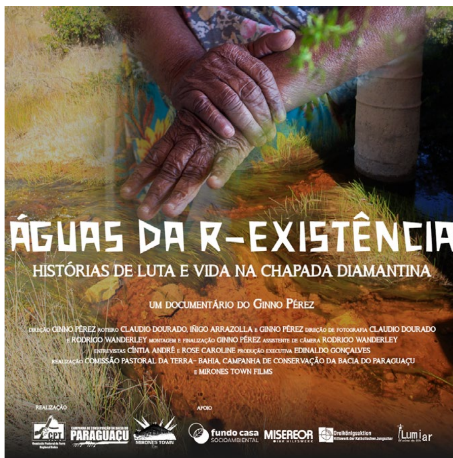
Flyer oficial del documental

Palavras-chave: r-existência territorial. Povos originários e tradicionais. Justiça hídrica. Chapada Diamantina.