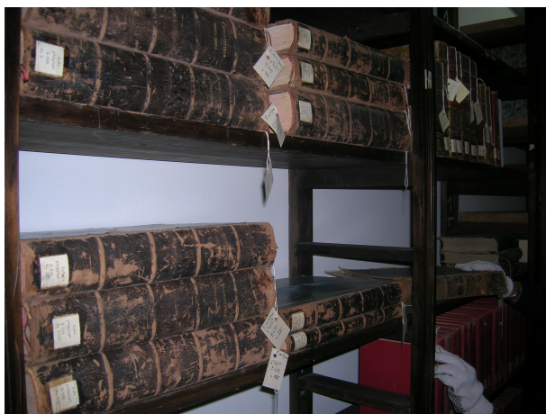
Almacenamiento de libros de gran tamaño