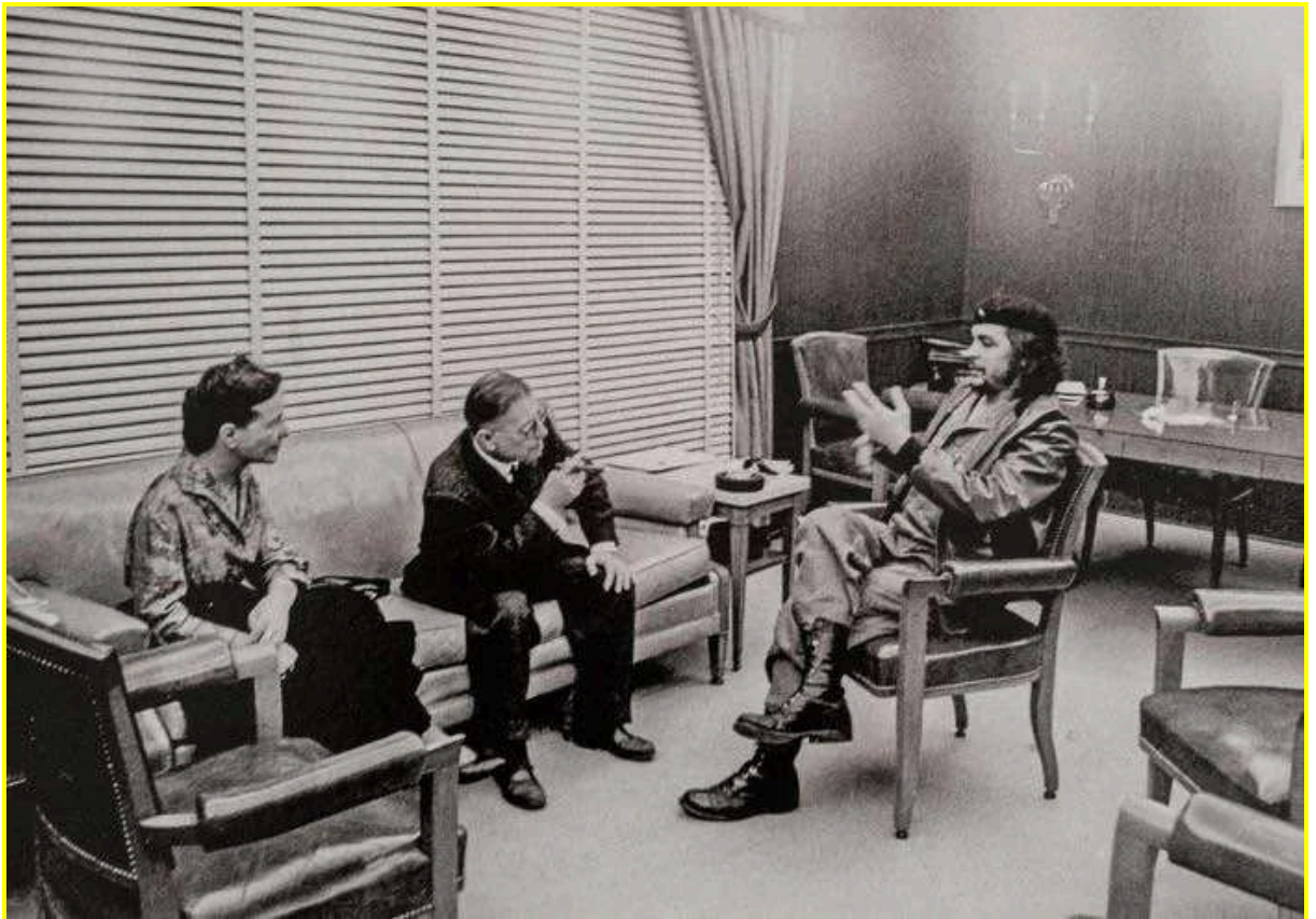
Simone De Beauvoir y Jean-Paul Sartre en una discusión con Ernesto "Che" Guevara, 1960.