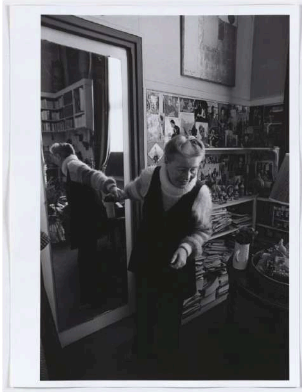
Simone De Beauvoir ; París 1980.