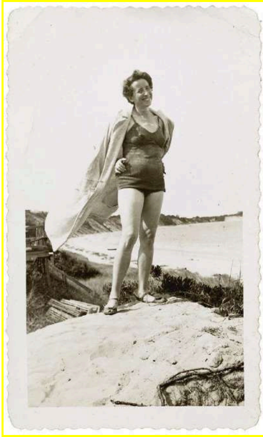
Hannah Arendt en la playa en Manomet, Massachusetts, julio de 1950