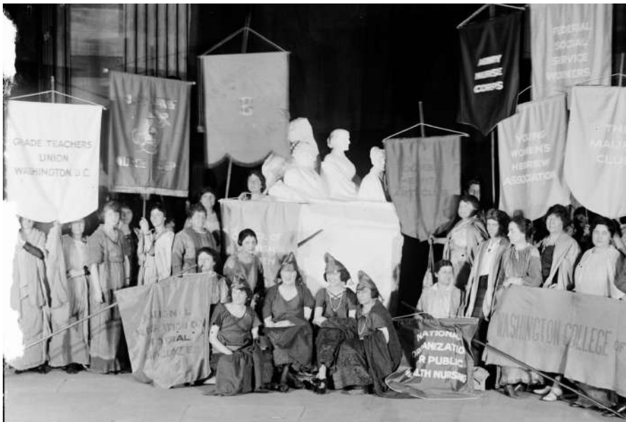
Grupo de mujeres con un monumento a las sufragistas Elizabeth Cady Stanton, Susan B. Anthony y Lucretia Mott, ca. 1921-23.